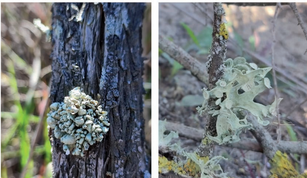
Figura 1. A l'esquerra Ramalina lusitanica . A la dreta un taflus de Ramalina pusilla . Fotografiades en el Garxal (Delta de l'Ebre) sobre Thymelaea hirsuta .

Els sensors (Garxal 1 i Garxal 2) han registrat dades des de l'1 de maig de 2022 fins al 30 d'abril de 2023. En aquests 365 dies, la T mitjana va ser de 19,4 °C (Garxal 1) i 19,3 °C (Garxal 2), quasi un grau més que a l'estació meteorològica de l'illa de Buda on, en el mateix període, la T mitjana va ser de 18,5 °C. L'amplitud tèrmica anual, calculada a partir de la mitjana mensual, va ser de 20,7 °C (Garxal 1) i 20,4 °C (Garxal 2), i només de 16,6 °C a l'illa de Buda (Figura 2). Si considerem, com diuen Lange et al. (1977) per a Ramalina maciformis (en una localitat costanera del desert de Negev, Israel), que una humitat relativa (Hr) de l'aire superior al 80% seria el valor límit inferior per a una activitat fotosintètica neta respecte a la respiració, en el Garxal 1 hem observat un total de 2.998 hores anuals en què se supera el 80% de Hr, i 2.910 en el Garxal 2 (Figura 3). Aquests valors són molt més alts a l'estació meteorològica de l'illa de Buda, on es registren un total de 4.321 hores en què la Hr és superior al 80%. Aquestes diferències entre l'estació meteorològica i els sensors posen en relleu la importància de tenir dades de microhabitat per descriure l'autoecologia d'aquestes espècies.