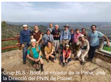
Grup BLS - Brioli al mirador de la Pena, amb la Direcció del PNIN de Poblet

Entre els dies 28 de juliol al 3 d'agost es va celebrar una trobada a Catalunya de la British Lichen Society (BLS) i el grup de líquens de Brioli-ICHN. En la trobada van participar membres de la BLS de les Illes Britàniques, d'Alemanya i d'Estats Units.