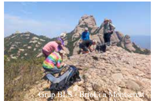
Grup BLS - Brioli a Montserrat

L'1 d'agost ens dirigim ben aviat als Pirineus, a la Molina, per pujar a la Tossa d'Alp. En aquesta ocasió observarem els líquens terrícoles i saxícoles d'aquest ambient prepirinenc. Les espècies a destacar serien: Xanthapychia contortuplicata , líquen saxícola inclòs en el Catàleg de flora amenaçada de Catalunya, i Vulpicida juniperinus , líquen que viu sobre els sòls i troncs en aquest tipus d'hàbitats de muntanya.