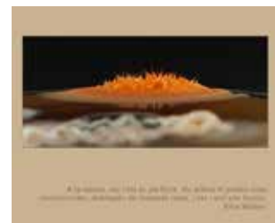
Macro d'un creixement