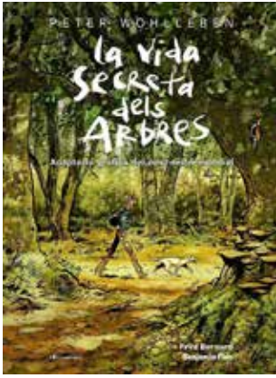
La vida secreta dels arbres. Adaptació gràfica del best seller mundial. PETER WOHLLEBEN. Cossetània Edicions, 2024. 240 pàgines.