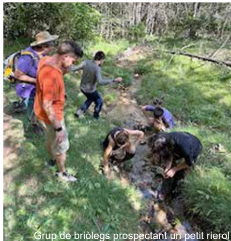
Grup de briòlegs prospectant un petit rierol

A la tarda ens vàrem desplaçar cap al municipi de Llivia, dins l'àmbit administratiu de Catalunya, on es varen prospectar alguns prats similars al del matí. I tot i que es varen