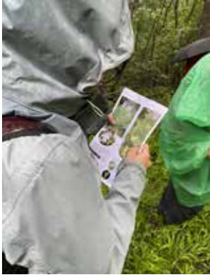
Miniguia de camp lliurada als inscrits.

D. fuchsii , curraia blanc ja fructificat ( Cephalanthera longifolia ) i fulles d'el·leborina, molt probablement, d'el·leborina vermella ( Epipactis atrorubens ).