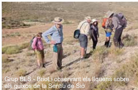
Grup BLS - Brioli observant els líquens sobre els guixos de la Sentiu de Sió