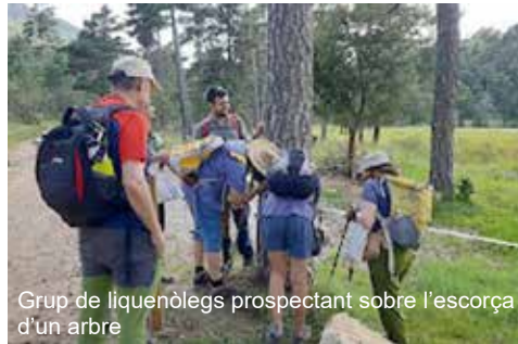
Grup de líquenòlegs prospectant sobre l'escorça d'un arbre

Finalment, volem agrair el suport de la ICHN per fer possible aquesta activitat en un entorn que, sens dubte, mereix una especial protecció. ■