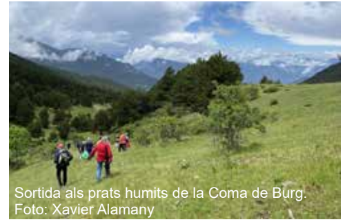
Sortida als prats humits de la Coma de Burg.

una assistent va trobar uns peus en poncelles d'epipactis. Per les fulles distants i l'ambient a la vora del bosc, s'evidenciava com a Epipactis distans , gens estrany a la zona.