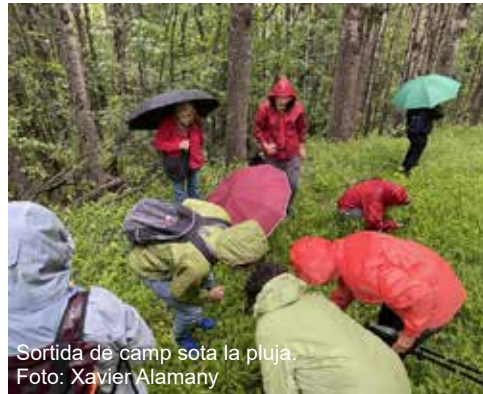
Sortida de camp sota la pluja.

Aquí es gaudeix d'una bona panoràmica dels pics que delimiten el Parc Nacional d'Aigüestortes i Estany de Sant Maurici, malgrat els núvols. D'un ramat de vaques, en va saltar una mare jove per intentar envestir-nos un parell de cops, sense cap conseqüències. Tot baixant, es travessa un prat ple d'orquis socarrat ( Neotinea ustulata ). Ja de tornada,