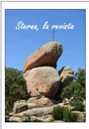
Sterna, la revista , número 30. Juny - setembre de 2024.

Al sortir de la UPC-Manresa que hostatja el Museu de Geologia ens vam dirigir al turó de Puigberenguer, un mirador excepcional per observar enllà en un dia nítid els horitzons de muntanyes que envolten la comarca de Bages i, més a la vora, la vall del Cardener i les seves terrasses. La població de Sant Joan de Vilatorrada se situa quasi íntegrament a la terrassa més baixa, a la riba dreta a uns 8-10 metres per sobre del riu; el regadiu del Poal ocupa una terrassa de l'esquerra a uns 30 metres; i el nostre punt d'observació, el Puigberenguer, és una altra terrassa de l'esquerra a uns 87 metres del nivell actual del Cardener. Gairebé tota la grava solta de Puigberenguer va ser explotada durant el segle XX; queden testimonis, la base de la terrassa feta de grava cimentada en conglomerat, i el turó pla a una alçada rebaixada.