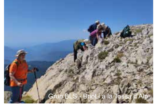
Grup BLS - Brioli a la Tossa d'Alp