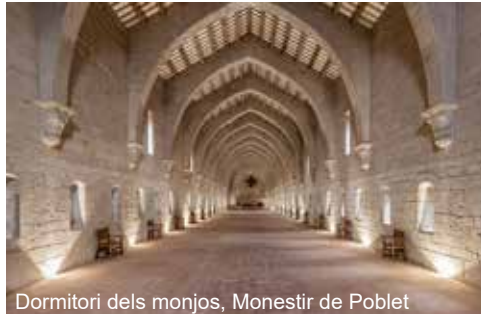
Dormitori dels monjos, Monestir de Poblet

de Poblet. En aquesta jornada vam comptar amb la directora del PNIN de Poblet, l'Éster Trullols, i els tècnics i Ricard Collado i l'Eloi Josa, que van explicar-nos les espècies botàniques que el PNIN de Poblet allotja i tot l'esforç que es realitza per incrementar el coneixement de la flora líquènica i la millora contínua per a la protecció dels hàbitats.