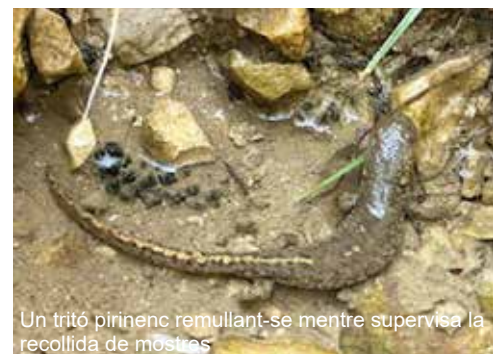
Un tritó pirinenc remullant-se mentre supervisa la recollida de mostres

amb dinar al camp inclòs, però van quedar sobradament compensades per les excel·lents sobretauls del vespre i el particular sentit de l'humor de molts dels integrants del grup.