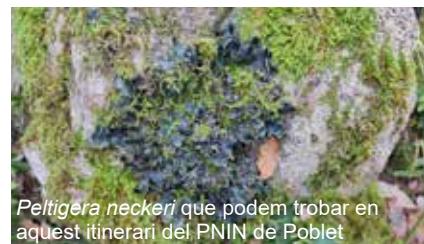
Peltigera neckeri que podem trobar en aquest itinerari del PNIN de Poblet

Dilluns 29 de juliol visitem el barranc de Castellfollit i seguim l'itinerari micològic que el PNIN de Poblet té preparat. L'objectiu d'aquesta primera excursió és l'observació dels líquens sobre roques silícies (granit i esquistos), líquens epífits sobre alzina, roure i pi roig, i els líquens terrícoles.