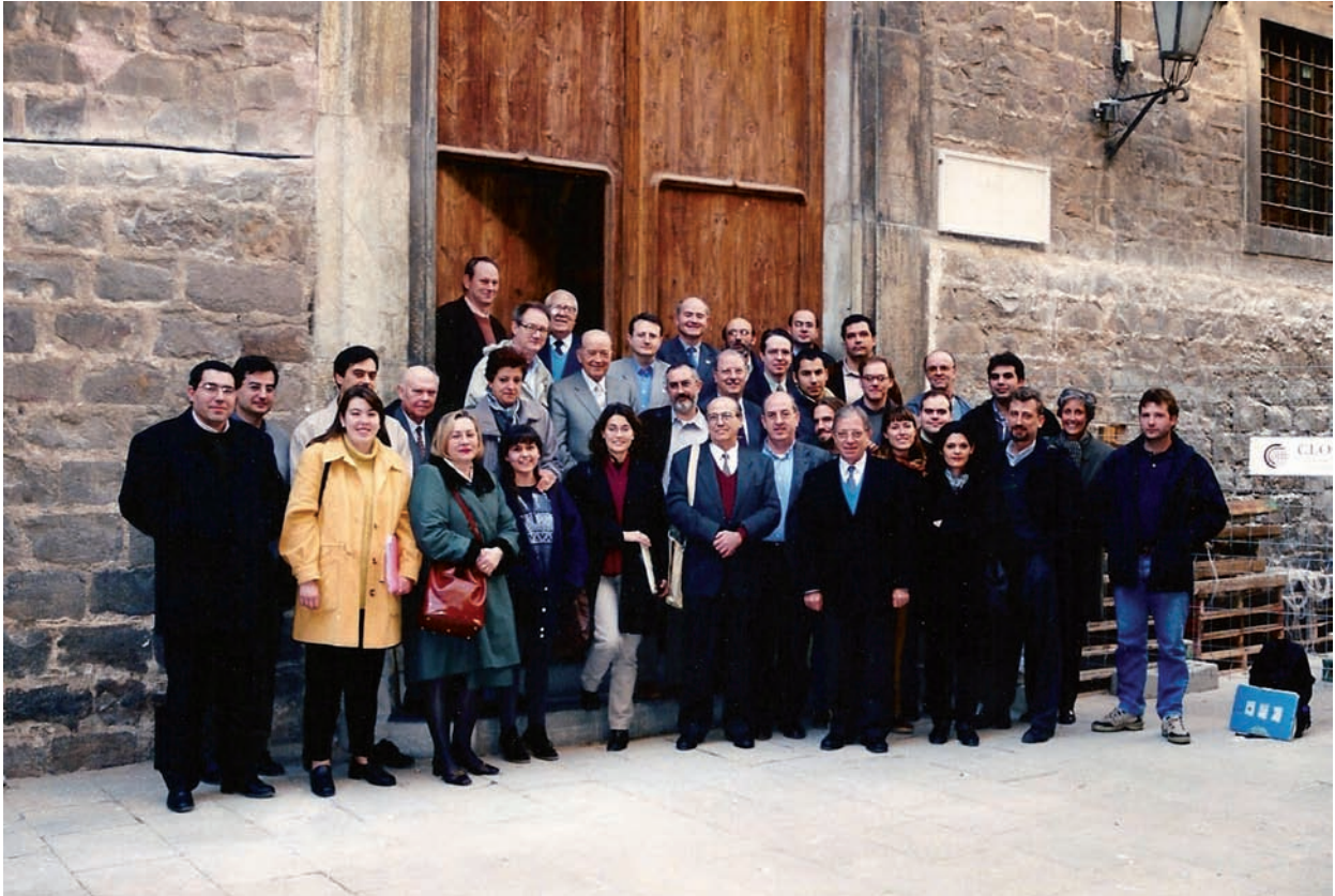
Figura 2. Assistents a la XI Sessió Conjunta d'Entomologia de la ICHN-SCXL, celebrada el 27 de novembre de 1999.