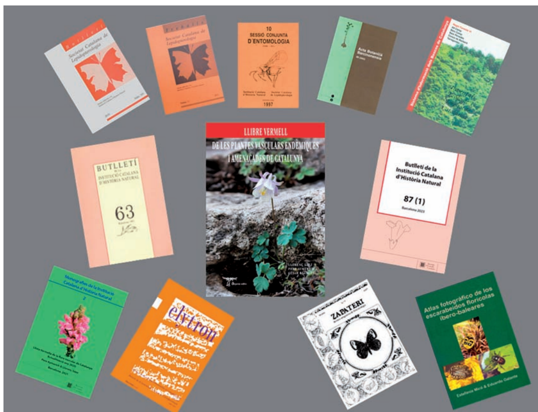
Figura 1. Algunes de les obres en les que l'Amador ha estat el maquetador (explicació al text).

històrics”, i es va especialitzar en l'edició textos, una activitat que ha fet fins a l'actualitat i ha constituït en part el seu modus vivendi . Fins i tot va fer programes informàtics, entre els quals destaca el que va dissenyar per al Corte Inglés i que servia per aconsellar el tipus de raqueta que havien de comprar els clients atenent a la seva musculatura i la seva força.