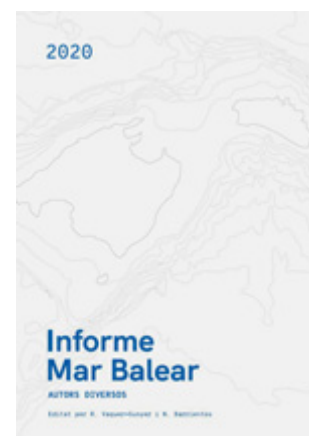
Vaquer-Sunyer; N. Barrientos. [ed.] 2020. Informe Mar Balear . Fundació Marilles.

Al llarg dels mesos i els anys que vindran, es continuarà fent feina per avançar en aquest projecte col·lectiu i sumar-hi noves institucions i col·laboracions. Amb el temps, entre tots, s'anirà perfeccionant i afinant el contingut de l'informe. ■