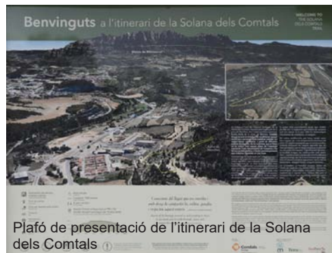
Plafo de presentació de l'itinerari de la Solana dels Comtals

La passera ha estat finançada per l'Ajuntament de Manresa i construïda per Grup Mas. Està situada poc més avall de la confluència de la riera de Rajadell al Cardener, a l'indret de Can Poc Oli que pren el nom de la casa més propera, i molt a prop del gran viaducte de la carretera C-55 que l'empetiteix. L'aparència de l'obra és simple: una plataforma de formigó de 35 metres de longitud per 1,95 metres d'amplada que queda al voltant d'un metre per sobre del nivell de l'aigua, sense baranes ni floritures que riuades o vàndals puguin malmetre.