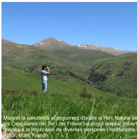
Malgrat la pandèmia, el seguiment d'ocells al Parc Natural de les Capçaleres del Ter i del Freser ha pogut quedar cobert gràcies a la implicació de diverses persones i institucions.

Les notícies van arribar de cop i en pocs dies tot va canviar. També la manera de fer el seguiment d'ocells. Gairebé d'un dia per l'altre ja no es podia accedir al medi natural i en poques setmanes començava el període de mostratge al camp (15 d'abril-16 de juny). Passat el període de major confinament, totes les instruccions que arribaven des de les autoritats evidenciaven que ens havíem de continuar quedant a casa. El lleure a la natura no estava permès, tampoc quan es va obrir per primer cop la possibilitat de fer esport en determinades franges horàries. Només va quedar oberta una esclatxa, la de l'activitat professional degudament justificada. Des de l'Institut Català d'Ornitologia (ICO), el Departament de Territori i Sostenibilitat i, en els casos que així ho requerien, altres administracions com la Diputació de Barcelona, es va estudiar amb deteniment la