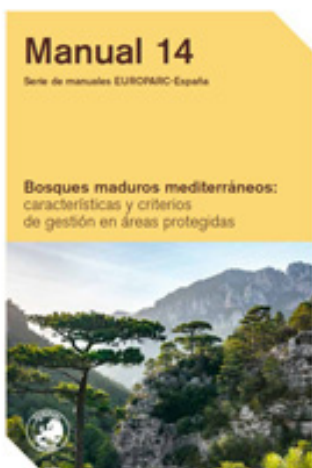
EUROPARC-España. 2020. Bosques maduros mediterráneos: características y criterios de gestión en áreas protegidas . Madrid: Fundación Fernando González Bernaldez.