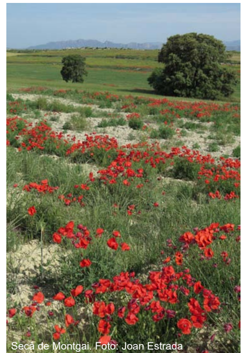
Secà de Montgai.

laries. A aquestes actuacions s'hi afegeixen molts altres projectes de diferents dimensions i característiques, però tots ells amb un denominador comú: roseguen pam a pam els hàbitats esteparis de la plana lleidatana. Bons exemples en són l'aeroport de Lleida-Alguaire, l'autovia de la Vall d'Aran, l'abocador comarcal del Segrià... però també moltes altres actuacions menors, però d'impactes molt significatius quan se sumen tots, com la construcció de nombroses granges disperses, plantes de compostatge en zones d'alt valor ecològic, graveres, edificis industrials, complexos fotovoltaics... En alguns casos s'han aplicat mesures compensatòries, com és el cas del regadiu Segarra-Garrigues i algunes graveres, però en la resta no s'ha aplicat cap tipus d'actuació per minimitzar o corregir l'impacte, o si s'han dictaminat no s'han aplicat o s'han aplicat tant deficientment que no assoleixen els mínims objectius fixats. Dos bons exemples d'aquesta situa-