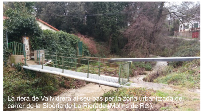
La riera de Vallvidrera al seu pas per la zona urbanitzada del carrer de la Sibèria de La Rierada (Molins de Rei).

Els autors del manifest, a més d'alertar de la fragilitat de la riera en un entorn metropolità i en el panorama actual de canvi global, acaben el text reclamant mesures urgents per aturar la degradació ecològica de l'àmbit de La Rierada. I més, havent-se iniciat recentment les obres d'excavació i moviment de terres a la zona de Les Llicorelles per la ubicació d'una àrea de logística industrial, que ha destruït els camps de conreu que hi havia al tram baix de la riera, uns espais que constituïen un coixí de transició fonamental per preservar l'estat ecològic del tram baix de la riera i del Parc Natural de Collserola. ■