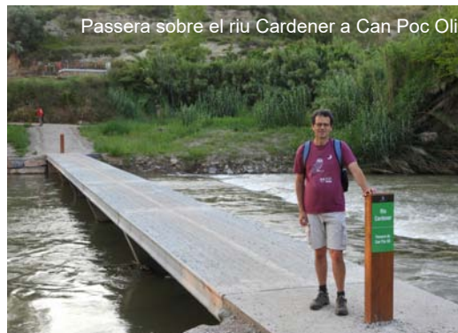
Passera sobre el riu Cardener a Can Poc Oli

L'ús generalitzat i immediat de la passera de Can Poc Oli i de l'itinerari de la Solana dels Comtals mostra que no ha de fer por a les administracions invertir en lleure a la natura, en educació ambiental i en itineraris per a vianants i ciclistes; són inversions petites que, si estan ben dirigides i executades, obtenen de seguida una resposta agraïda i fomenten la implicació ciutadana en les qüestions de la natura. ■