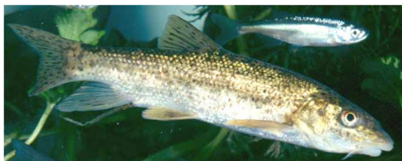
Figura 1. Fotografia del barb-cua roig ( Barbus haasi )

individus (un 5-6%) es desplacen més de 100 m al llarg de la riera, fet que fa que la població sigui extremament sensible a qualsevol canvi que es produeixi en el medi. Aquesta sensibilitat va quedar palesa en l'estudi de detall realitzat per Figuerola et al. (2012) de 40 trams de riera al llarg de 2 km dins la reserva natural (entre el Torrent de les Tres Serres i Can Madolell): van trobar un total de 1331 peixos de mides compreses entre els 3 i els 20 cm de llargària (juvenils i adults respectivament). La densitat de la població, la seva estructura i l'estat fisiològic dels individus venien determinats per la composició química de l'aigua i el règim hidrològic del tram, i ràpidament responien a qualsevol petita alteració que es produïa en aquests paràmetres.