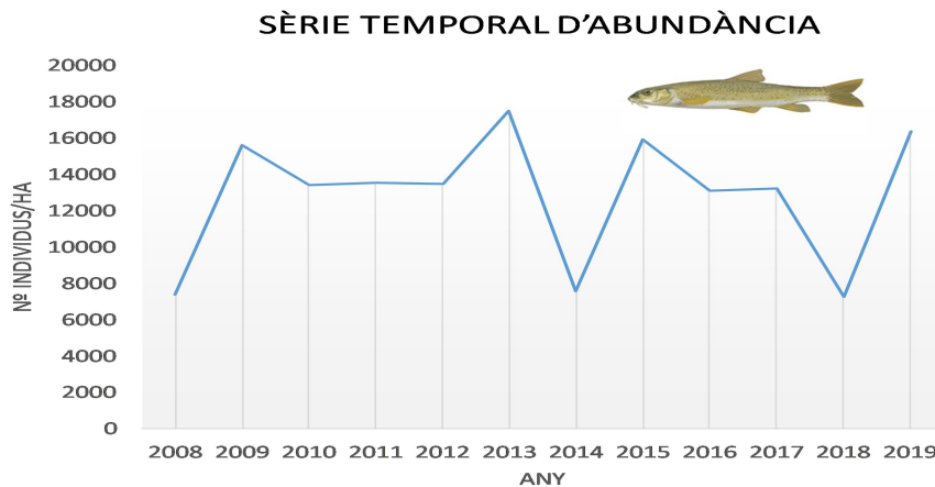
Figura 2. Densitat de la població del barb cua-roig a la riera de Vallvidrera, tram 500-600 m entre Can Modolell-Can Castellví, des del 2008 fins a l'actualitat.