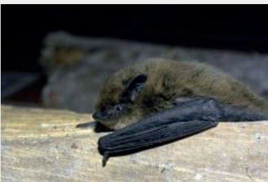
Ratpenat comú ( Pipistrellus pipistrellus )

Totes dues espècies són de mida molt petita. De fet, el ratpenat soprano ( Pipistrellus pygmaeus ) és considerat el més petit