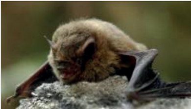
Ratpenat soprano ( Pipistrellus pygmaeus ).

Aquestes dues espècies són considerades espècies bessones perquè morfològicament són molt semblants. La seva diferenciació taxonòmica és molt recent i fins fa pocs anys eren considerades la mateixa espècie. A escala genètica, la diferenciació és clara. A nivell morfològic, la diferenciació és més difícil, però hi ha certes característiques que ens poden ajudar a esbrinar de quina espècie es tracta. Una característica inequívoca que els diferencia són les emissions ultrasòniques, que és un dels trets que permet distingir amb relativa facilitat les dues espècies. En el cas del ratpenat soprano ( Pipistrellus pygmaeus ), els sons d'ecolocalització són més aguts que en l'altra espècie, per la qual cosa se l'anomena soprano.