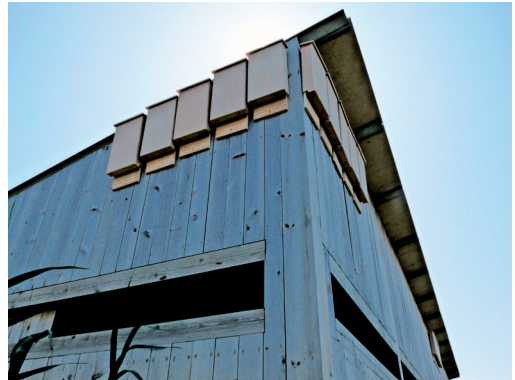
FIGURA 1. Caixes niu per a ratpenats instal·lades al delta del Llobregat.

vament grossa que poden depassar els 40 cm d'envergadura.