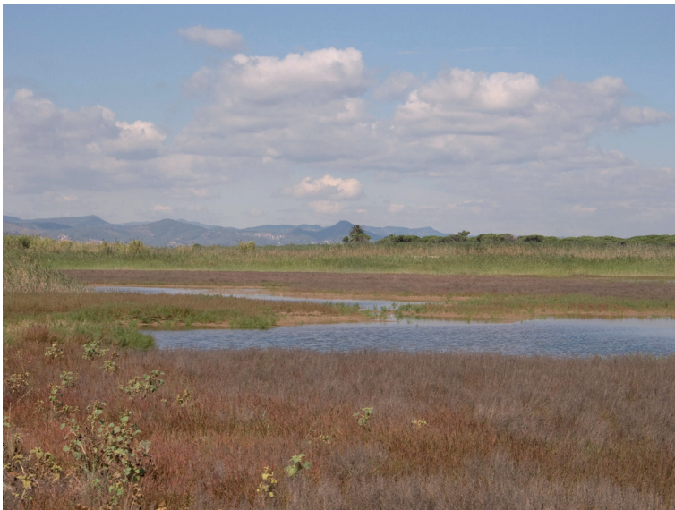
FIGURA 7. Platja de Ca l'Arana.

Cal esmentar que, com a conseqüència de tots aquests canvis, es va plantejar la creació del Consorci per a la Protecció i Gestió dels Espais Naturals del Delta del Llobregat per a