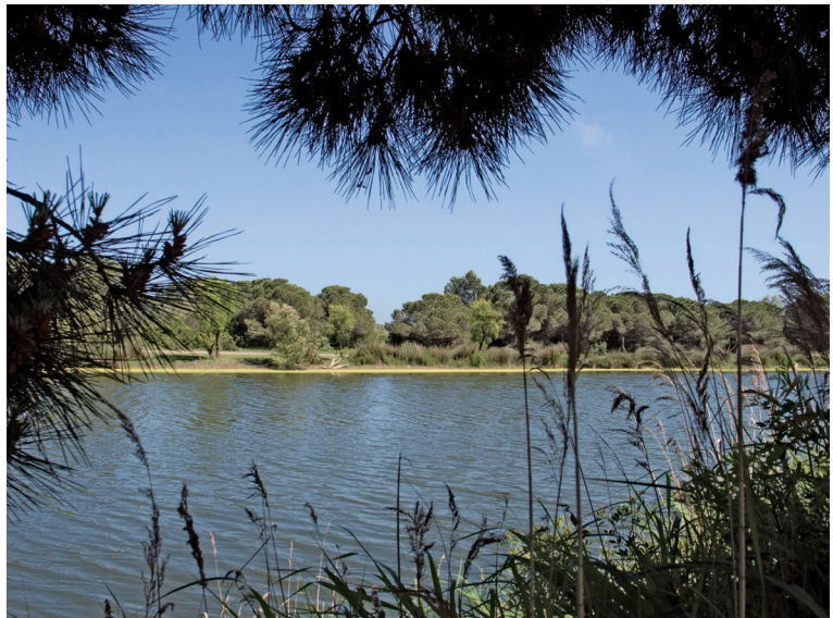
FIGURA 2. Reserva natural parcial del Remolar-Filipines.

Posteriorment, s'aprovà el Decret 275/1999, de modificació del Decret 226/1987, del 9 de juny, de declaració de les reserves