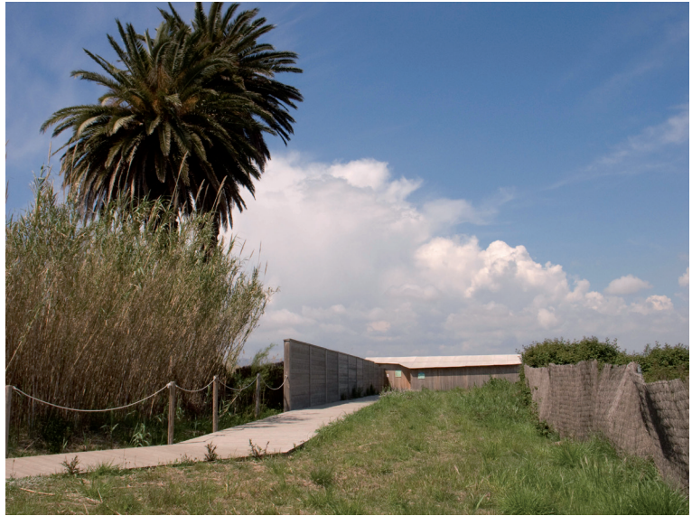
FIGURA 8. Aguait de Cal Tet.

Llobregat, consorci integrat per les administracions estatal, autonòmica i local i que delegà la gestió del riu a la Mancomunitat de Municipis de l'Àrea Metropolitana de Barcelona (MMAMB).