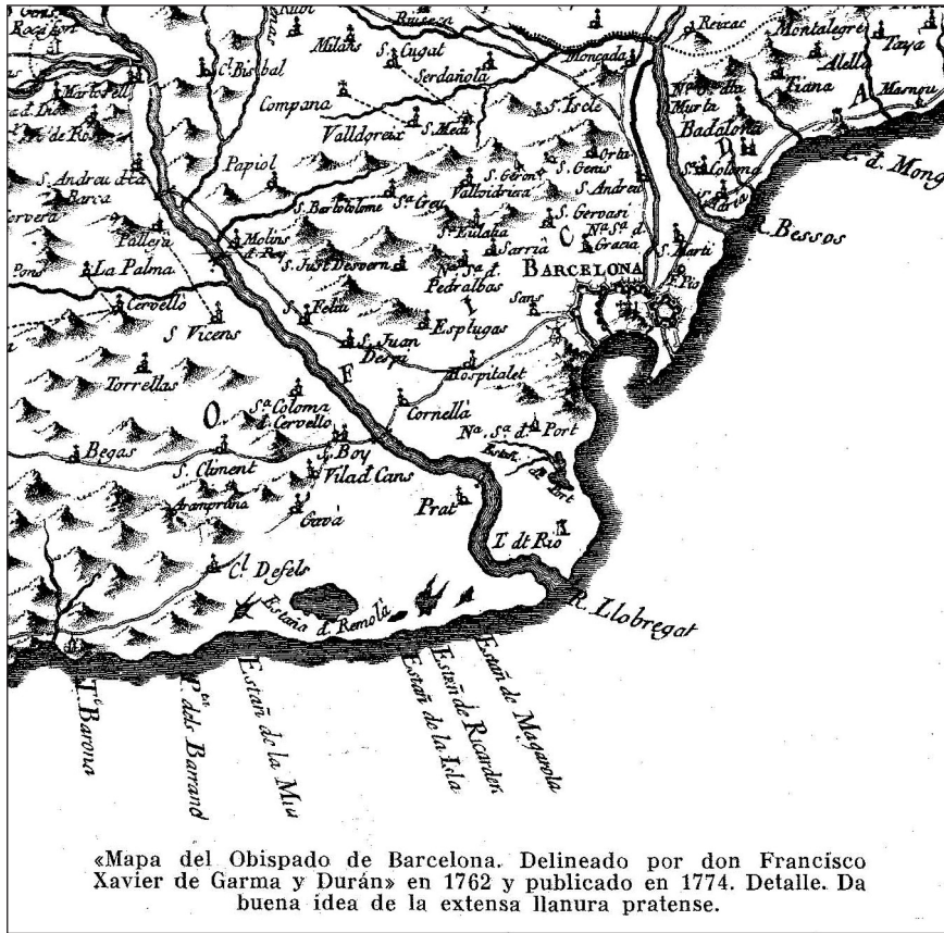
FIGURA 1. Mapa del delta del Llobregat al segle XVIII extret de Prat de Llobregat (Ensayo histórico). El Prat de Llobregat, 1958.

punt s'han aconseguit els objectius proposats en cada una de les iniciatives endegades, però possiblement el lector es podrà fer una primera idea dels resultats assolits quan repassi les dades exposades en altres articles d'aquesta mateixa publicació, especialment els relacionats amb l'estudi dels organismes i els sistemes naturals.