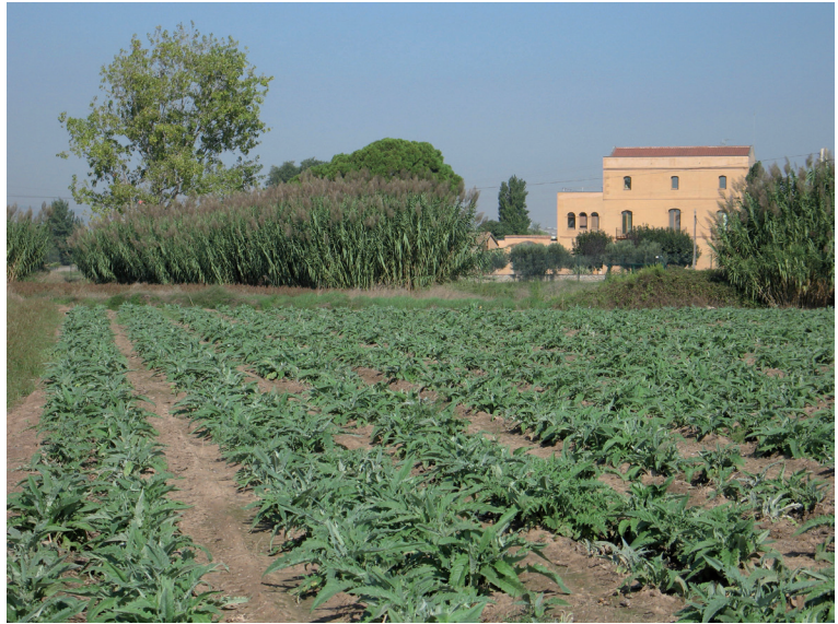
FIGURA 5. Parc Agrari del Baix Llobregat.

al sòl rústic protegit de valor agrícola (clau 24) i al sòl rústic de valor agrícola amb servituds aeronàutiques (clau 24a), tot i que incideix també sobre altres tipus de sòl, com els inclosos al sistema de parcs i jardins urbans i al sistema hidrològic del riu Llobregat. El parc agrari abasta 2.938 ha, superfície sobre la qual opera la normativa del pla especial, tot i que també s'hi plantegen determinacions complementàries per a gestionar d'acord amb els objectius del parc agrari un àmbit territorial més ampli, d'unes 3.332 ha, i que inclou, a més, aquells altres sòls agraris qualificats pel PGM com a sistema.