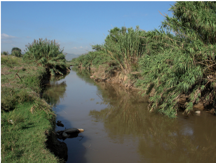
FIGURA 6. Riu Llobregat prop de la desembocadura.

A més del domini públic maritimoterrestre, la Llei de costes preveu una zona de servitud de protecció de cent metres on només es permeten obres, instal·lacions o activitats