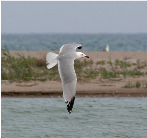
FIGURA 3. Gavina corsa.

al 2006, però en ambdós casos la seva incidència sobre les poblacions d'aquestes espècies que es troben al delta del Llobregat ha estat mínima.