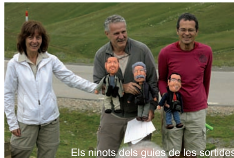
Els ninots dels guies de les sortides

La sortida acabà amb la celebració de fi de curs. Hi hagué premis en reconeixement a les actituds positives, simpàtics ninots fets de buata en rèplica dels tres guies habituals i un bon berenar. ■