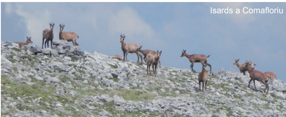
Isards a Comafloriu

panyaven, cadascuna d'elles amb les seves particularitats. De la carena de Tosa d'Alp ressenyem l'artemisa de muntanya ( Artemisia umbelliformis ) que a la regió dels Alps francesos s'utilitza per aromatitzar el licor gènépi; Androsace villosa , una primulàcia de delicada i abundosa florida; el ranuncle de pedrusca ( Ranunculus parnassifolius ) amb la roseta de fulles ovades de nervis paral·lels; l'espunyidella pirinenca ( Galium pyrenaicum ), minúscula, amb fulles i flors de 4 pètals amb reflexos argentats, l'erísim nan ( Erysimum sylvestris ssp. pyrenaicum ), una crucífera en petit coixinet cobert de flors grogues que no s'ha de confondre amb la gregòria ( Vitaliana primuliflora ), una primulàcia de flors també grogues però en tub; el gavó alpi ( Ononis cristata ) mostrant