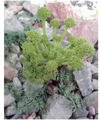
Julivert d'isard ( Xatardia scabra )

La part alta del massís és ocupada per extensos prats on pasturen vaques, cavalls i ovelles, i també ramats salvatges d'isards. Durant la baixada a coll de Pal, sortint de l'itinerari freqüentat pels excursionistes vam trobar-nos amb un ramat d'una cinquantena d'isards que, mantenint-se a una distància prudent, ens miraven encuriósits.