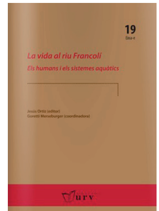
La vida al riu Francolí: els humans i els sistemes aquàtics . ORTIZ, JESÚS [ed.]. 2014. Tarragona: Publicacions URV.

Ja s'ha endegat el Butlletí de la ICHN , número 78. Tal com vam anunciar, els primers articles ja es poden consultar al web de la ICHN.