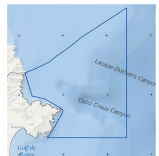
LIC Sistema de canons submarins occidentals del golf de Lleó.