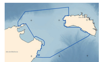
LIC Canal de Menorca.