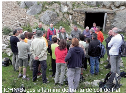
ICHN=Bages a la mina de barita de coll de Pal

Jornades «La salut i els espais naturals». 22 i 23 de setembre a l'Auditori de La Pedrera, Barcelona. Les jornades s'adrecen a professionals del món sanitari, als gestors dels espais naturals, tècnics municipals, als divulgadors de ciència i natura i a la ciutadania interessada. Cal inscripció prèvia (gratuïta) a territori@fcatalunyalapedrera.com