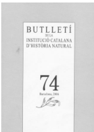
Butlletí de la Institució Catalana d'Història Natural , núm. 74. ICHN, Barcelona, 2007. 188 p.

També es va remarcar la importància de que les entitats científiques com la