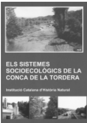
Els sistemes socioecològics de la conca de la Tordera . ICHN, Barcelona, juny de 2008. 541 p.