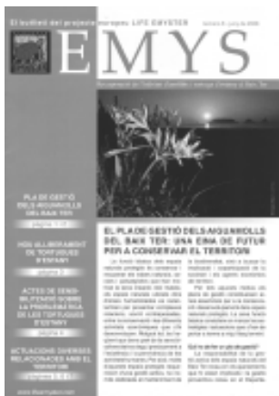
EMYS. El butlletí del projecte europeu LIFE EMYSTER, número 6, juny de 2008.8 p.

reglament del Consell Consultiu per tal que sigui aquest mateix que esculli el seu president, i no hagi de ser per força el gerent del consorci. Segons sembla, quan la Generalitat entri a formar part del consorci, s'hauran de modificar els reglaments de funcionament intern i llavors es podran introduir aquestes modificacions. També es va instar al consorci a posicionar-se en contra de la tallada d'alzines al cim del Tibidabo i la construcció de la nova muntanya russa per l'impacte al parc i per l'augment de l'afluència de visitants i vehicles. La resposta fou que aquesta muntanya russa es fa dins de la legalitat i acompanyada d'un estudi d'impacte ambiental que preveu mesures correctores i compensatòries i que s'ha previst limitar l'accés amb vehicle al cim del Tibidabo i prioritzar l'accés amb transport públic.