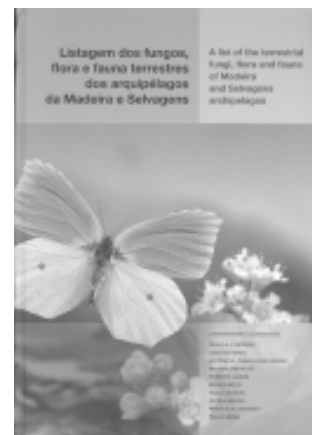
Listagem dos fungos, flora e fauna terrestres dos arquipélagos da Madeira e Selvagens. 438 p. Iniciativa Comunitària Interreg III B 2000-2006, juny de 2008. ISBN: 978-989-95790-0-2.