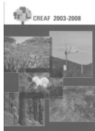
CREAF 2003-2008. CREAF-UAB, març de 2008. 132 p. ISBN: 978-84-935211-03.

També es van explicar els acords de la Comissió Executiva del consorci relatiu a les propostes elevades des del Consell Consultiu, entre elles la proposta de modificació del