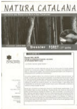
Natura Catalana. La lettre des Réserves Naturelles Catalanes. Dossier Forêt (2 ème partie), juliol de 2008. 12 p.