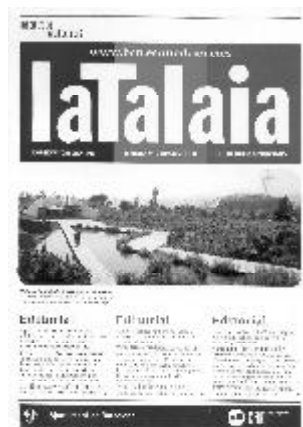
LaTalaia. Institut de Cultura. Ajuntament de Barcelona. Juliol de 2001. 47 p.

Si esteu interessats a participar-hi, consulteu l'adreça d'internet: http://www.diba.es/parcs/stllorenc/activ.htm