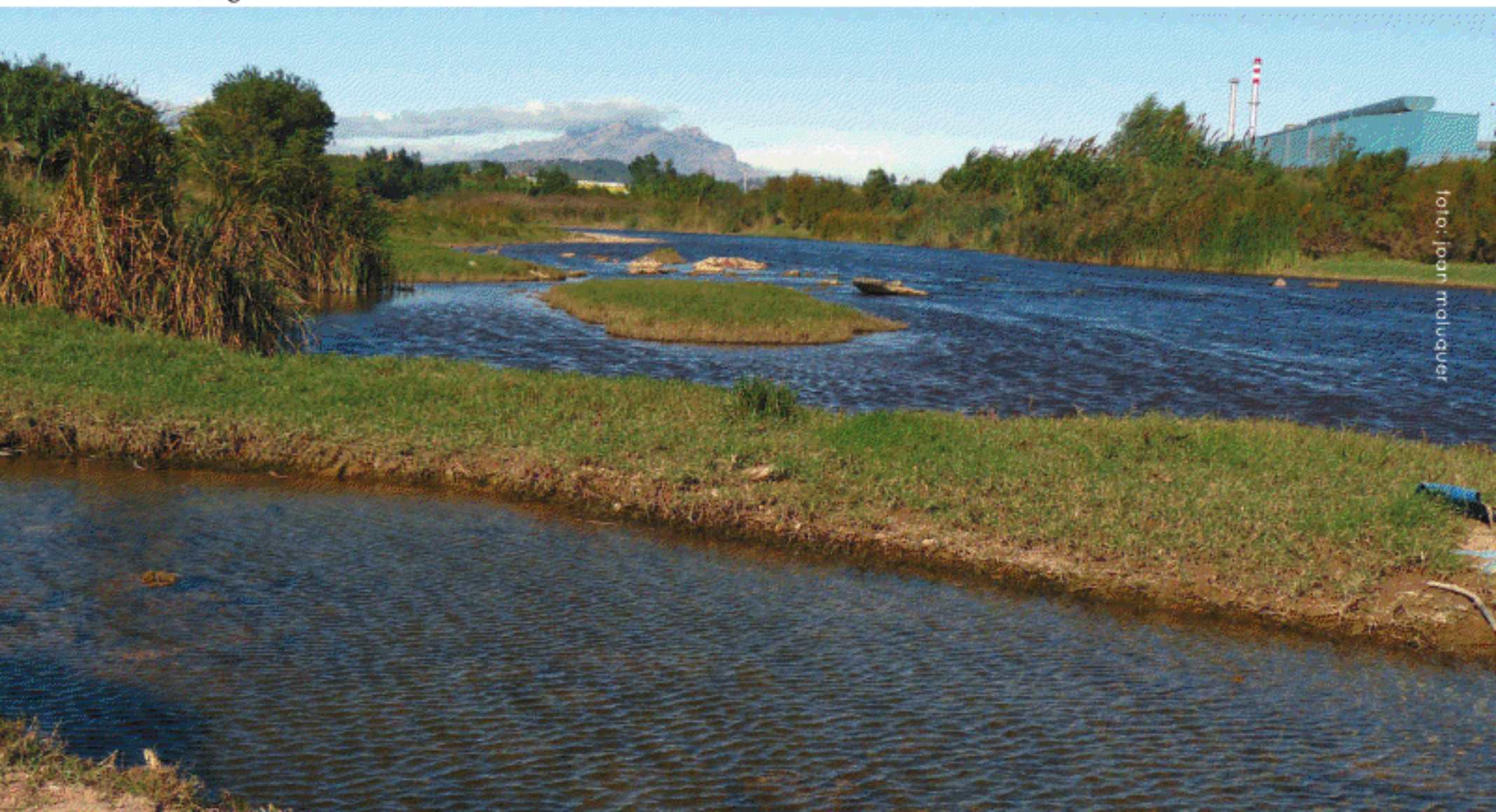
El riu Llobregat a Sant Andreu de la Barca