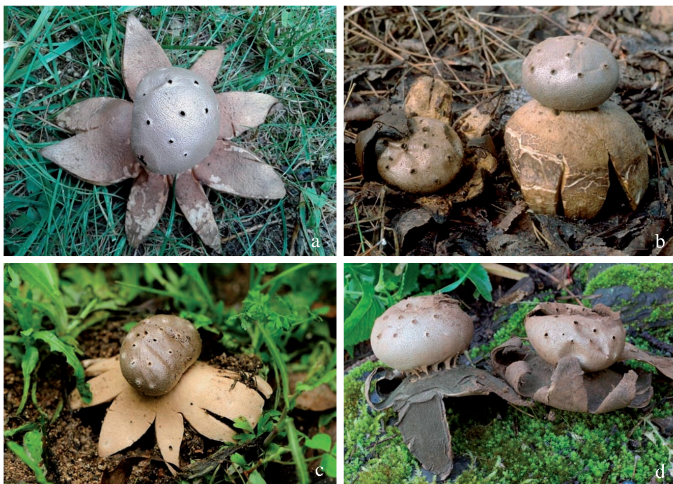
Figura 1. Imatges de Myriostoma coliforme : a) al torrent de cal Manreset d'Argentona (M. Guardiola); b) als voltants de Sant Hilari Sacalm (J. Llistosella); c) a la riera de Riudameia d'Argentona (J. Corbera); d) a la font Groga de Sant Cugat del Vallès (S. Santamaria).

Project database (Pando et al. , 2016) només estan georeferenciades tres citacions del centre de la península Ibèrica. Calonge (2004) comenta que és un fong relativament freqüent a la península Ibèrica, i no està inclòs al catàleg espanyol d'espècies amenaçades, però sí que és present a la Lista Roja de Hongos a proteger de la Península Ibèrica (ADESPER, 2008).